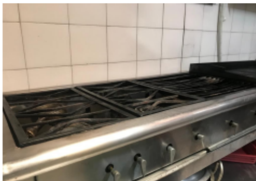
Fotografía 3. Estufa de cuatro puestos