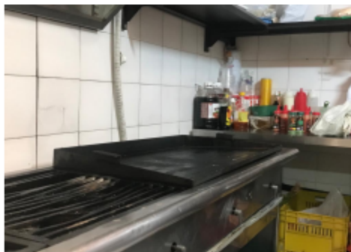
Fotografía 4. Plancha