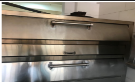
Fotografía 7. Horno pizzero