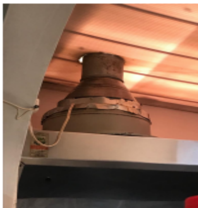
Fotografía 5. Extractor y conexión al ducto