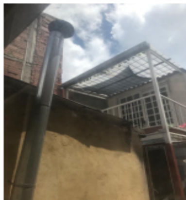
Fotografía 6. Punto de descarga del ducto